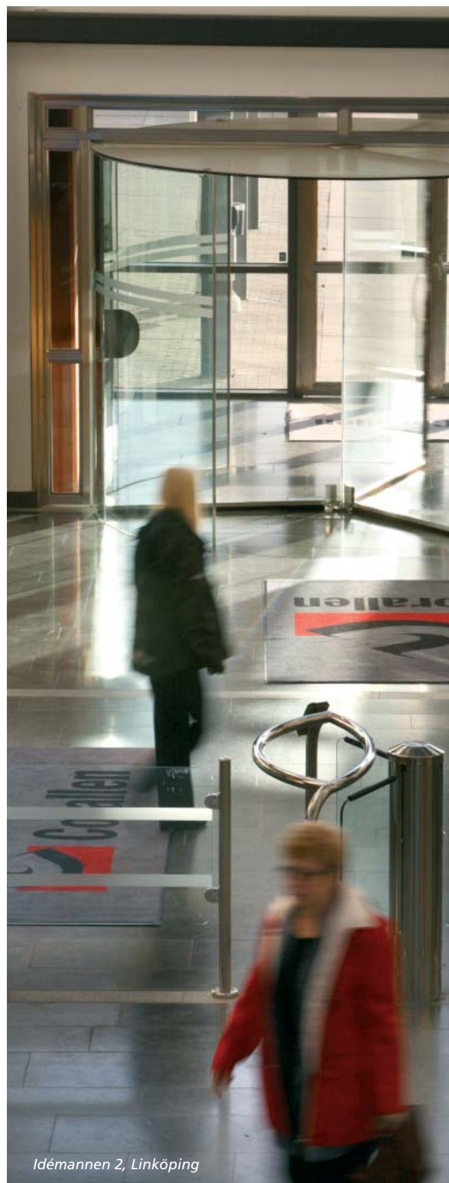
Idémannen 2, Linköping

Castellum har en småskalig organisation med ca 30-40 anställda i respektive bolag vilka tillsammans förvaltar knappt 600 kostnadsställen. All verksamhet bedrivs i dotterbolagen medan finansverksamheten bedrivs i moderbolaget, innebärande att Castellum AB inte utgör ett profit-center. Detta medför att ekonomifunktionen i moderbolaget utgör controllerfunktion gentemot dotterbolagen samt compliance officer-funktion gentemot finansavdelningen. Sammantaget medför detta att det inte anses motiverat att ha en särskild enhet för internrevision.