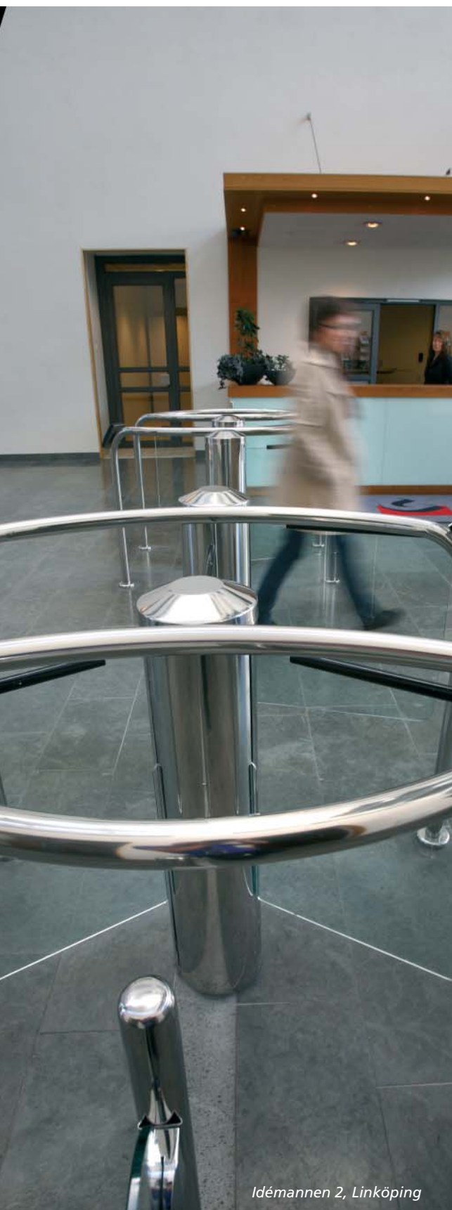
Idémannen 2, Linköping

Aktiekapitalet uppgår till 86 003 354 kronor, fördelat på 172 006 708 aktier med ett kvotvärde om vardera 0,50. Varje aktie, förutom återköpta egna aktier om 8 006 708 stycken, berättigar till en röst och medför lika rätt till andel i Castellums kapital. Castellum har ingen direktregistrerad aktieägare med ett innehav överstigande 10%.