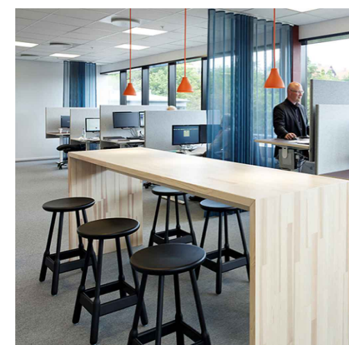
Inspirationbild - Touchdown möbler