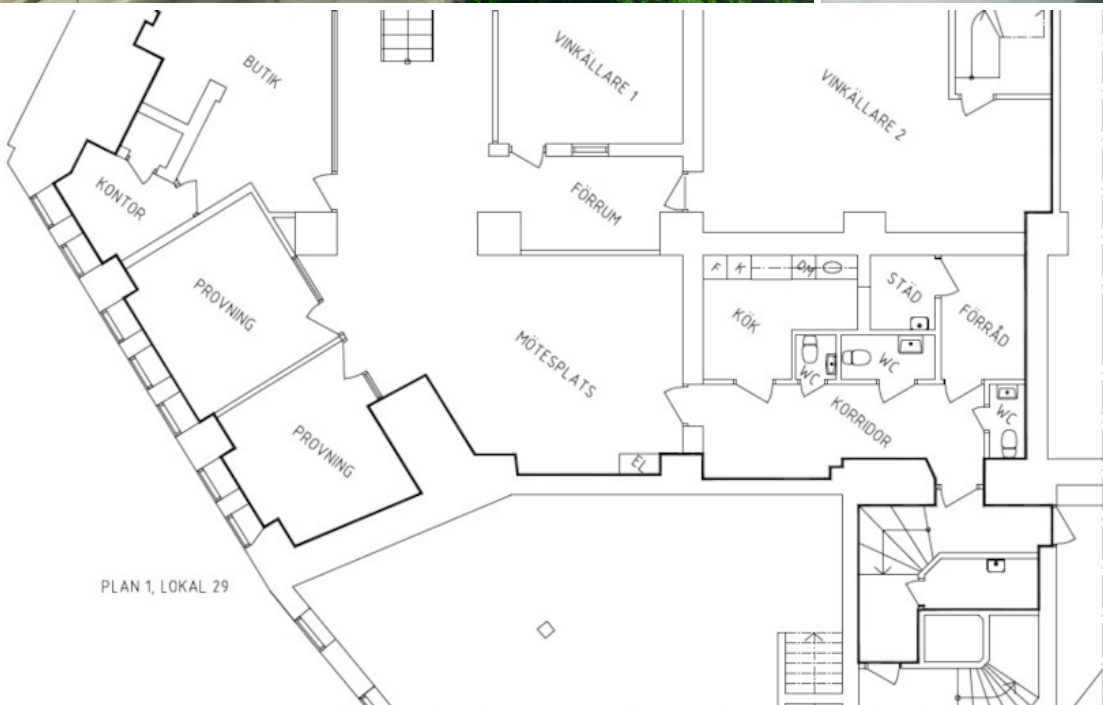
PLAN 1, LOKAL 29