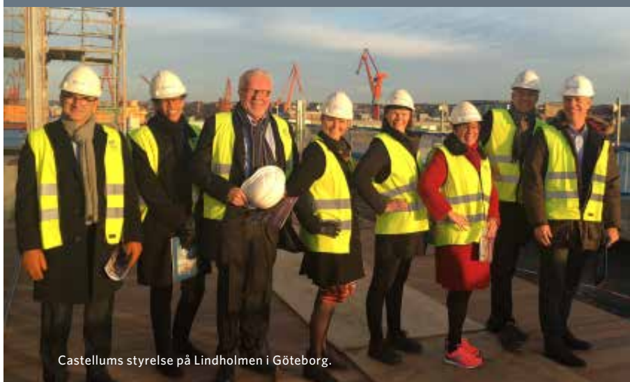
Castellums styrelse på Lindholmen i Göteborg.

Ett resultat av Castellums samlade hållbarhetsarbete är att bolaget i hård global konkurrens under 2016 valdes ut att ingå i det prestigefyllda hållbarhetsindexet DJSI, Dow Jones Sustainability Index.