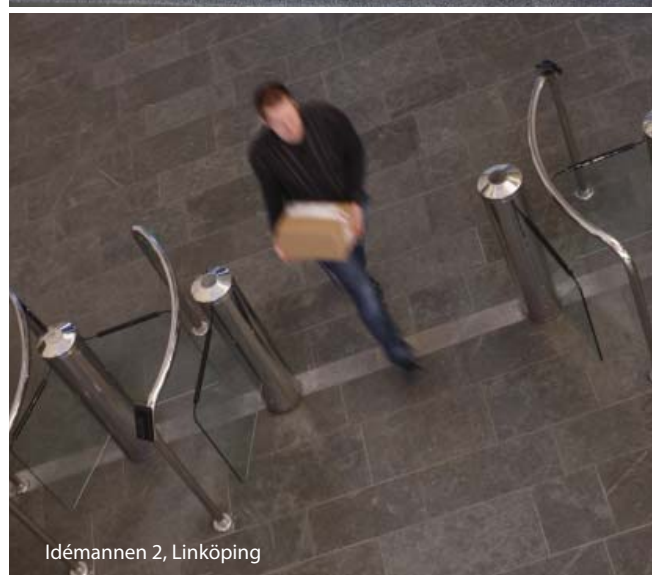
Idémannen 2, Linköping