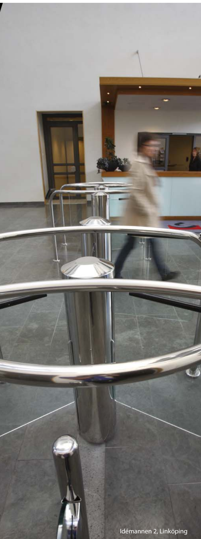
Idémannen 2, Linköping

Aktiekapitalet uppgår till 86 003 354 kronor, fördelat på 172 006 708 aktier med ett kvotvärde om vardera 0,50. Varje aktie, förutom återköpta egna aktier om 8 006 708 stycken, berättigar till en röst och medför lika rätt till andel i Castellums kapital. Castellum har ingen direktregistrerad aktieägare med ett innehav överstigande 10%.