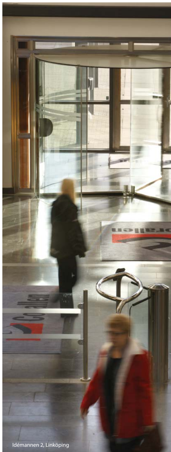
Idémannen 2, Linköping

Castellum har en småskalig organisation med ca 30-40 anställda i respektive bolag vilka tillsammans förvaltar knappt 600 kostnadsställen. All verksamhet bedrivs i dotterbolagen medan finansverksamheten bedrivs i moderbolaget, innebärande att Castellum AB inte utgör ett profit-center. Detta medför att ekonomifunktionen i moderbolaget utgör controllerfunktion gentemot dotterbolagen samt compliance officer-funktion gentemot finansavdelningen. Sammantaget medför detta att det inte anses motiverat att ha en särskild enhet för internrevision.